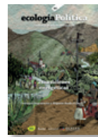
65 TRANSICIONES ENERGÉTICAS Juny 2023

La pèrdua de biodiversitat és un problema crític, que s'interrelaciona amb el canvi climàtic i que posa en risc la viabilitat pròpia de les societats humanes. Abordar aquesta problemàtica requereix la col·laboració de governs, organitzacions socials i ambientals, comunitats locals, etc. però la solució del qual és difícil si no s'aborda la lògica de creixement indefinit del sistema econòmic actual, ni la conseqüent, constant i creixent pressió humana sobre els ecosistemes.