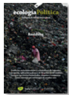
68 RESIDUOS Diciembre 2024

El 2024 es van publicar els següents números: