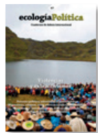
67 VIOLENCIAS Y EXTRACTIVISMOS Juny 2024

Explora la problemàtica dels residus com a símptoma i conseqüència d'un model econòmic insostenible basat en el consum i el creixement il·limitat. Analitza com aquestes deixalles no només contaminen, sinó que reflecteixen profundes desigualtats socials i econòmiques. Des de l'ecologisme dels pobres i les lluites de moviments recicladors, es qüestionen les solucions tecnocràtiques que perpetuen la injustícia ambiental i presenten alternatives transformadores. Models de gestió basats en justícia social i ecològica, iniciatives pel decreixement i el reconeixement dels recicladors com a actors clau inspiren un canvi cap a sistemes més justos i sostenibles.