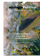
66 BIODIVERSIDAD Diciembre 2023

El 2024 també es van alliberar dos números, fins aleshores només disponibles per a subscriptores i subscriptors: