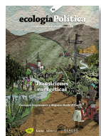
65 TRANSICIONES ENERGÉTICAS Junio 2023

La pérdida de biodiversidad es un problema crítico, que se interrelaciona con el cambio climático y que pone en riesgo la propia viabilidad de las sociedades humanas. Abordar esta problemática requiere la colaboración de gobiernos, organizaciones sociales y ambientales, comunidades locales, etc. pero cuya solución es difícil si no se aborda la lógica de crecimiento indefinido del sistema económico actual, ni la consecuente, constante y creciente presión humana sobre los ecosistemas.