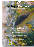
66 BIODIVERSIDAD Diciembre 2023

El 2023 se publicaron los siguientes números: