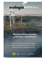
64 NUEVOS PACTOS VERDES Diciembre 2022

En 2023 también se liberaron dos números, hasta el momento sólo disponibles para suscriptores y suscriptoras: