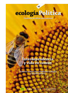
63 INTERDEPENDENCIA Y VIDA EN COMÚN Junio 2022

La crisis ecológica, la emergencia climática, la fuerte movilización social anti-sistémica y la pandemia han transformado las relaciones geopolíticas globales y provocaron una gran presión política para emprender acciones globales con compromisos para reducir las emisiones de carbono y reemplazar los combustibles fósiles por otras fuentes de energía alternativa. Estos esfuerzos han sido enmarcados a través de los llamados Green New Deals (GND), o Nuevos Pactos Verdes que, teóricamente, eran llamados a ser el marco estratégico para abordar la necesaria transformación hacia una economía libre de carbono.