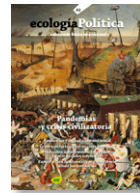
62 PANDEMIAS Y CRISIS CIVILIZATORIA Diciembre 2021

El 2022 també es van alliberar dos números, fins aleshores només disponibles per a subscriptores i subscriptors: