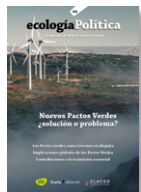
64 NUEVOS PACTOS VERDES Diciembre 2022

El 2022 es van publicar els següents números: