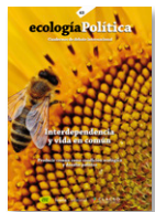
63 INTERDEPENDENCIA Y VIDA EN COMÚN Juny 2022

La crisi ecològica, l'emergència climàtica, la forta mobilització social antisistèmica i la pandèmia han transformat les relacions geopolítiques globals i provocat una gran pressió política per emprendre accions globals amb compromisos per reduir les emissions de carboni i reemplaçar els combustibles fòssils per altres fonts d'energia alternativa. Aquests esforços han estat emmarcats a través dels anomenats Green New Deals (GND), o Nous Pactes Verdes que, teòricament, eren cridats a ser el marc estratègic per abordar la transformació necessària de l'economia lliure de carboni.