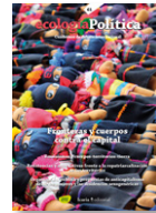
61 CUERPOS Y FRONTERAS CONTRA EL CAPITAL Juny 2021

Pandèmia no és només aquella malaltia que s'expandeix topogràficament, sinó també la metàfora idònia per entendre l'avanç dels patrons de poder que s'afermen a les narratives de la modernitat, del capitalisme, del patriarcat i de la colonialitat. El número explora la relació intrínseca entre el desenvolupament d'un sistema econòmic insostenible, que va més enllà dels límits físics del planeta, i la destrucció de la vida sobre aquest.