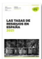
LAS TASAS DE RESIDUOS EN ESPAÑA 2021

Observatorio de la fiscalidad de los residuos