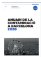
ANUARI DE LA CONTAMINACIÓ A BARCELONA 2020

La iniciativa tiene la voluntad de facilitar información de calidad y actualizada de la situación de la contaminación en la ciudad, señalando la tendencia de los principales contaminantes y los principales hitos del año.