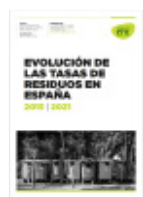
EVOLUCIÓN DE LAS TASAS DE RESIDUOS EN ESPAÑA 2015-2021

En su realización, se analizaron las tasas domiciliarias y comerciales de 125 municipios, incluidas todas las capitales de provincia. Este estudio da continuidad a análisis anteriores realizados con datos de 2015, 2018, 2019 y 2020.