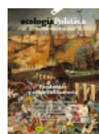
62 PANDEMIAS Y CRISIS CIVILIZATORIA Diciembre 2021

El 2021 se publicaron los siguientes números: