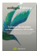
60 MESOAMÉRICA Y EL CARIBE Diciembre 2020

En 2021 también se liberaron dos números, hasta el momento sólo disponibles para suscriptores y suscriptoras: