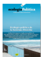
59 EXTREMA DERECHA Junio 2020

El número reflexiona sobre ecologías decoloniales en el área de Mesoamérica y el Caribe. A través de una completa selección de artículos analiza críticamente un campo conformado por luchas muy diversas. Desde el movimiento zapatista, los territorios mayas y las múltiples visiones entorno el lema por un “mundo donde quepan muchos mundos”, pasando por las luchas eco-territoriales de varios pueblos indígenas y movimientos afrocaribeños. Este número se presenta en un momento clave en el que el proyecto de la modernidad occidental -fundamentado y posible por el proyecto colonial, racial y patriarcal- es cuestionado en todas sus aristas.