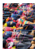
61 CUERPOS Y FRONTERAS CONTRA EL CAPITAL Junio 2021

Pandemia no es solo aquella enfermedad que se expande topográficamente, sino también la metáfora idónea para entender el avance de los patrones de poder que se afianzan con las narrativas de la modernidad, del capitalismo, del patriarcado y de la colonialidad. Explora la relación intrínseca entre el desarrollo de un sistema económico insostenible, que va más allá de los límites físicos del planeta, y la destrucción de la vida sobre este.