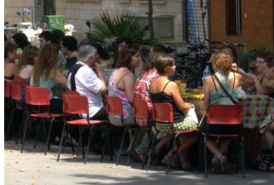
[#aprofitem] El Plat de Gràcia. Aprofitament d'excedents per menjars populars