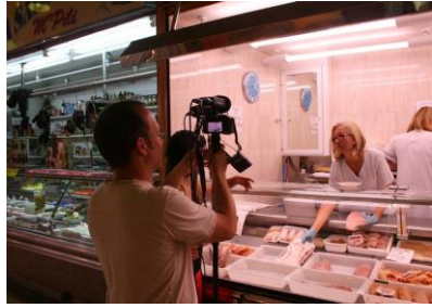
[#aprofitem] Botiga Solidària de Cornellà de Llobregat. Canalització en mercats municipals