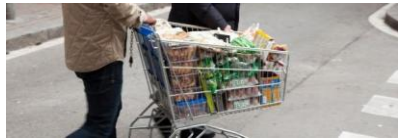
[#aprofitem] Programa de minves del Banc dels Aliments. Canalització d'excedents de supermercats