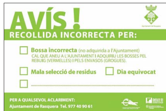
Figura 3. Adhesivo utilizado en las inspecciones del sistema de pago por generación en Rasquera. El adhesivo utilizado en Miravet es análogo

Si bien el sistema está aún en fase de consolidación, el modelo de pago por generación implantado en ambos municipios goza de buena aceptación y los resultados provisionales indican que han aumentado significativamente los niveles de recogida selectiva.